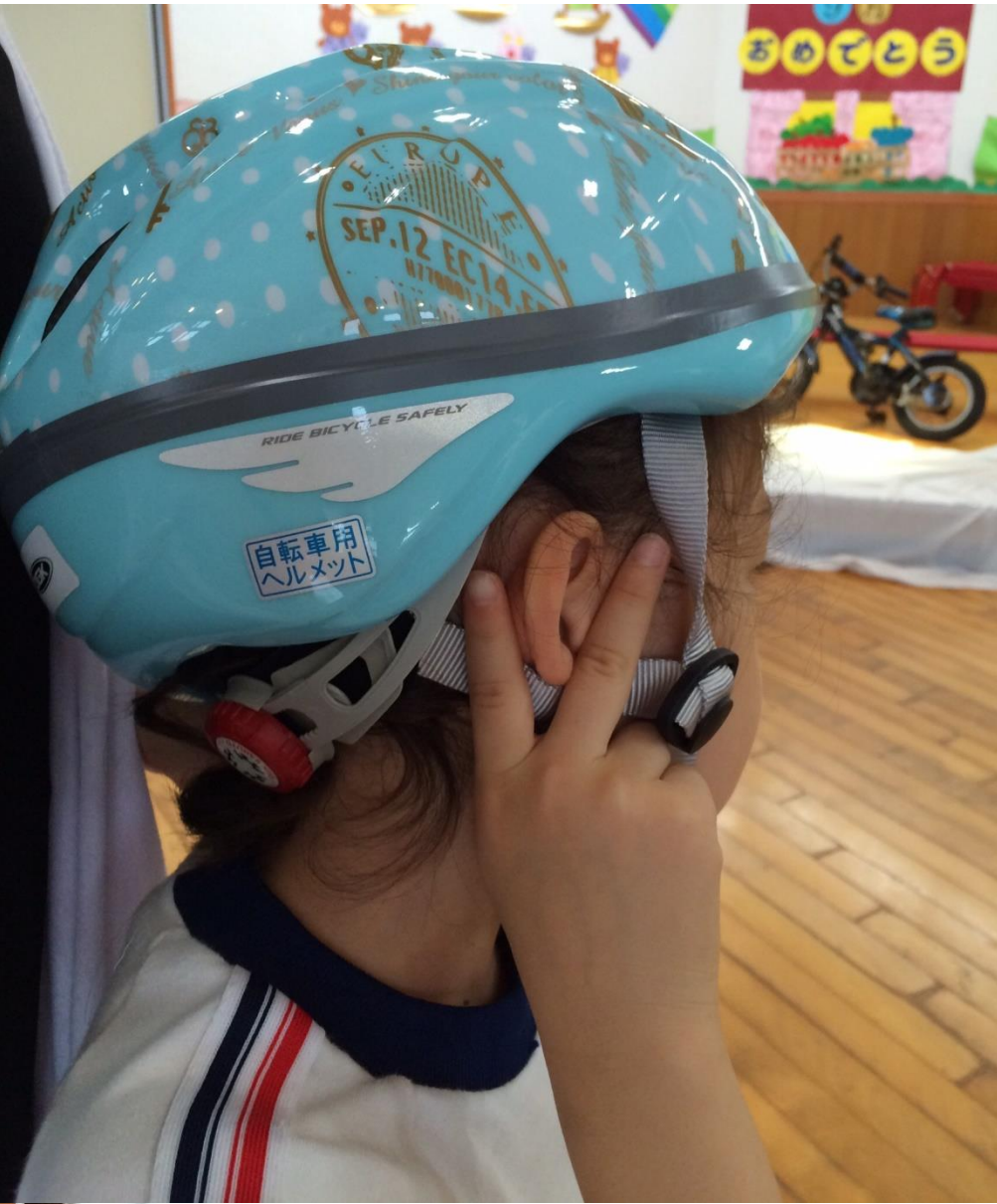
Safety Kids Izumi - all you need is love and safety -